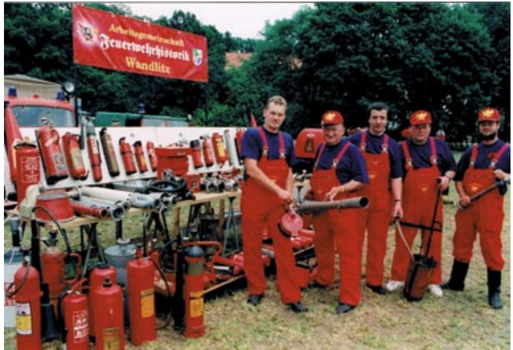
Präsentation der Arbeitsgemeinschaft Feuerwehrhistorik.

Gründung der „Arbeitsgemeinschaft Feuerwehrhistorik“. Mitglieder mussten eine Prüfung ablegen und erhielten einen Pass. Anerkennung der künstlerischen Aktivität von Volkskunstkollektiven für die Lustige Feuerwehr Wandlitz, Fachgebiet Humoristische Darbietung.