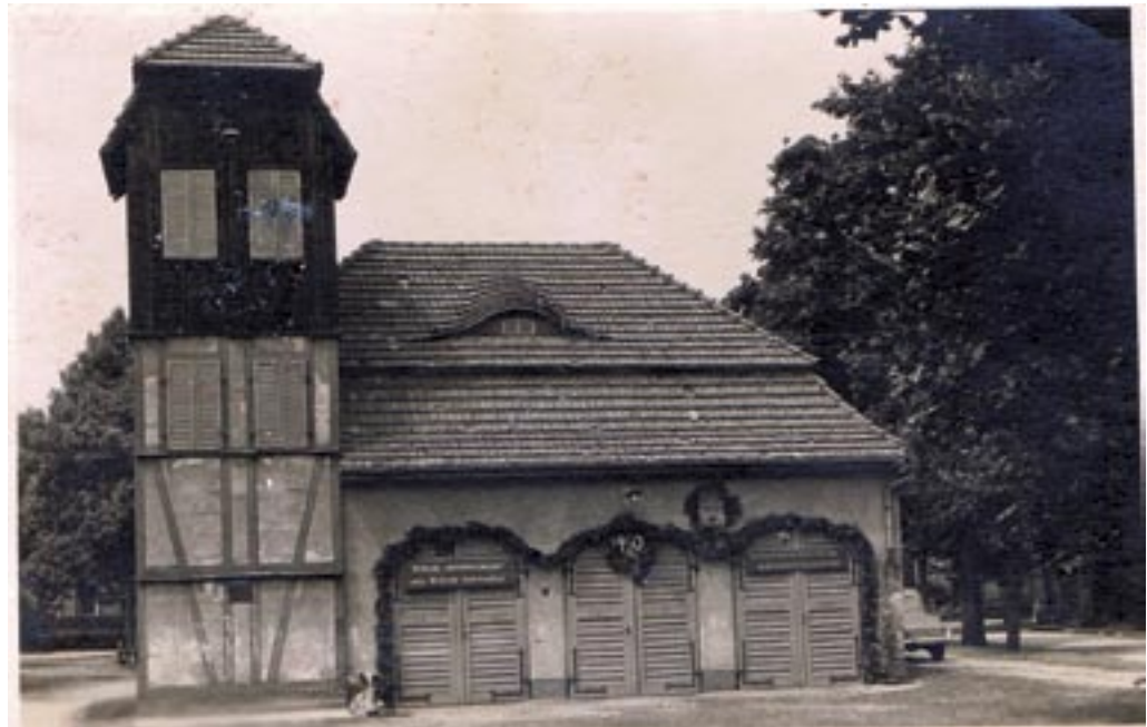
Das Gerätehaus im Jahr 1951.

Unter den gegebenen Umständen und mit den zur Verfügung stehenden Mitteln der Nachkriegszeit führten die Kameraden der Freiwilligen Feuerwehr Wandlitz ihren Dienst durch und rückten zum Einsatz wieder mit der Pferdespritze aus.