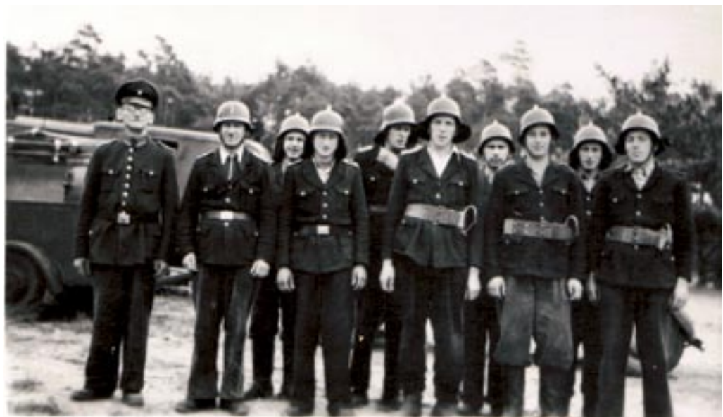
Die Wandlitzer Wehr im Jahr ihres 40-jährigen Bestehens.

40 Jahre Freiwillige Feuerwehr Wandlitz. Vier Jahre nach dem Krieg ist die Not noch groß. Und so wurde auch das 40-jährige Bestehen der Wandlitzer Wehr mit bescheidenen Mitteln gefeiert.