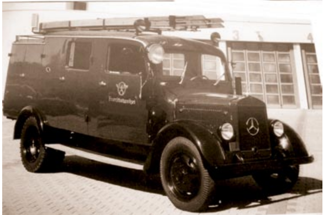
Löschfahrzeug von der Firma Mercedes. 1943.

Die Feuerwehr Wandlitz erhält ein Mercedes-Löschfahrzeug in Sonderausführung, sandfarben gespritzt, zur Absicherung des Rüstungsbetriebes Flugmotorenwerk BRAMO