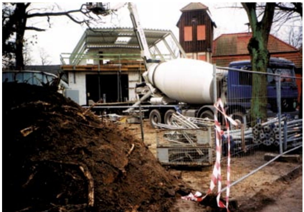
Darauf hatte man lange gewartet. An- und Neubau des Gerätehauses.

Die Freiwillige Feuerwehr Wandlitz erhält einen neuen Anbau am Gerätehaus.