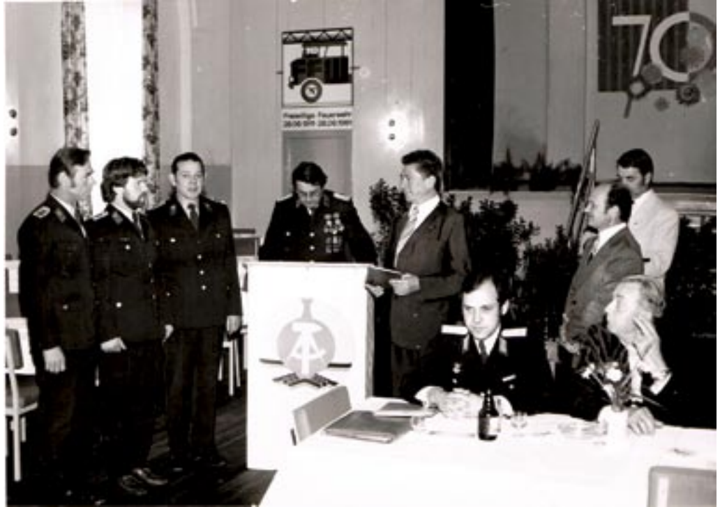
Feier zum 70. Jahrestag der Freiwilligen Feuerwehr Wandlitz im Gasthaus „Goldener Löwe“.

Festsitzung zum 70. Jahrestag der Freiwilligen Feuerwehr Wandlitz im Gasthaus „Goldener Löwe“. Die Ansprache hielt Bürgermeister Suhl, und er führte im Anschluss auch die Beförderungen und Ehrungen durch. Durch den Rat der Gemeinde wurde der Freiwilligen Feuerwehr Wandlitz eine Kollektivprämie in Höhe von 1000 Mark überreicht.