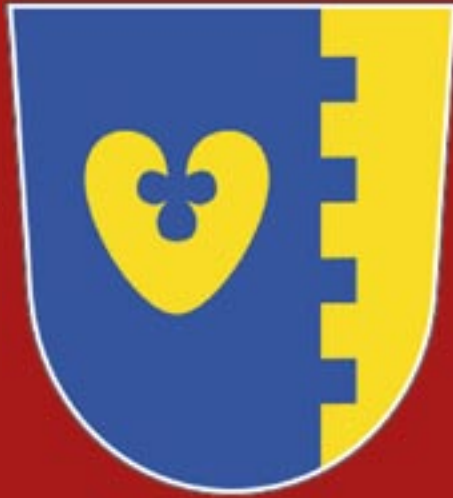
Wappen der Großgemeinde Wandlitz