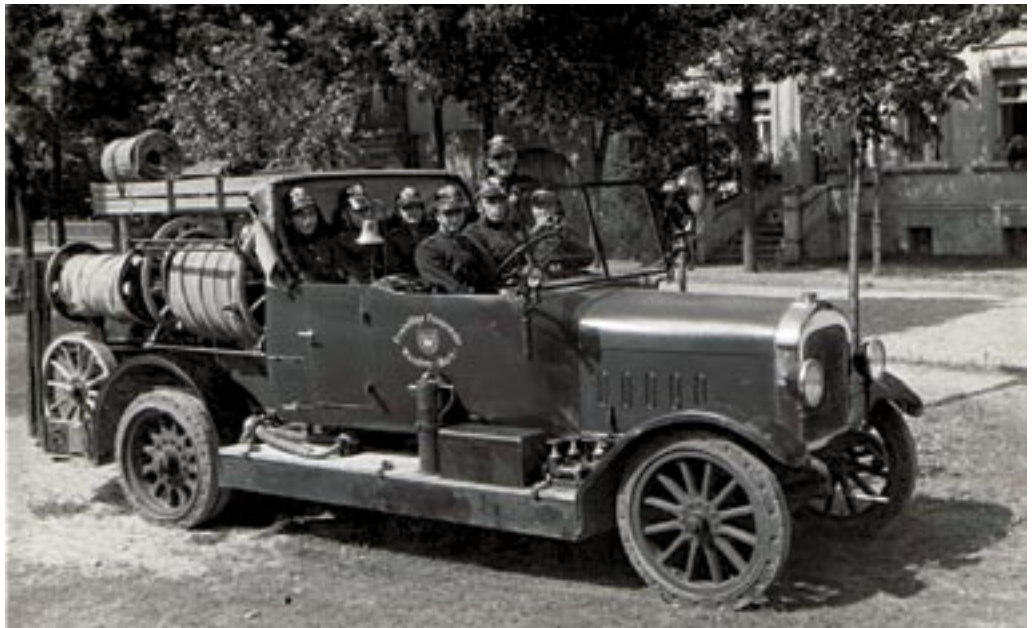
Überland-Motorlöschzug. Vollgummi-bereift der Firma Flader. Angeschafft 1927.