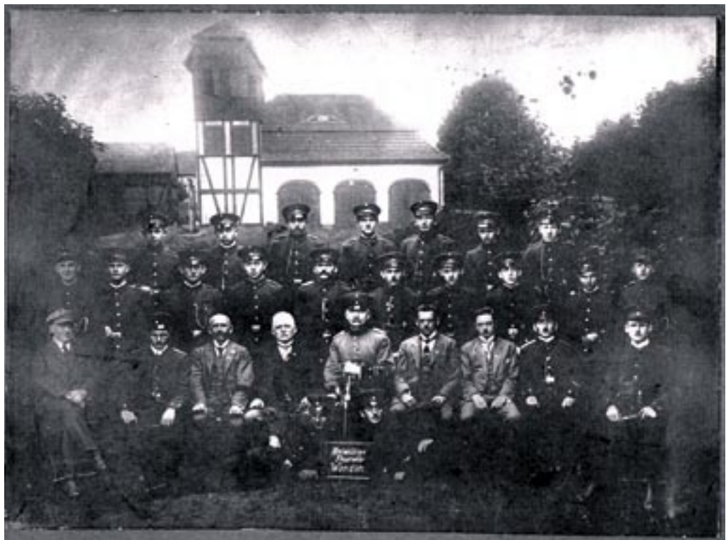
Gruppenbild vor dem Greätehaus im Jahr 1918.