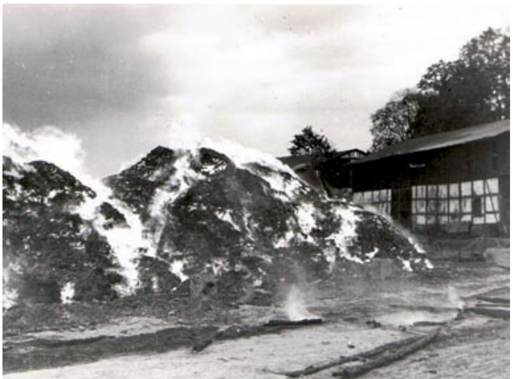
Großfeuer auf dem Gut Annenhof.

Großfeuer zerstört die Scheune auf dem Gut Annenhof, bei dem 25 Kameraden zwölf Stunden im Einsatz waren.